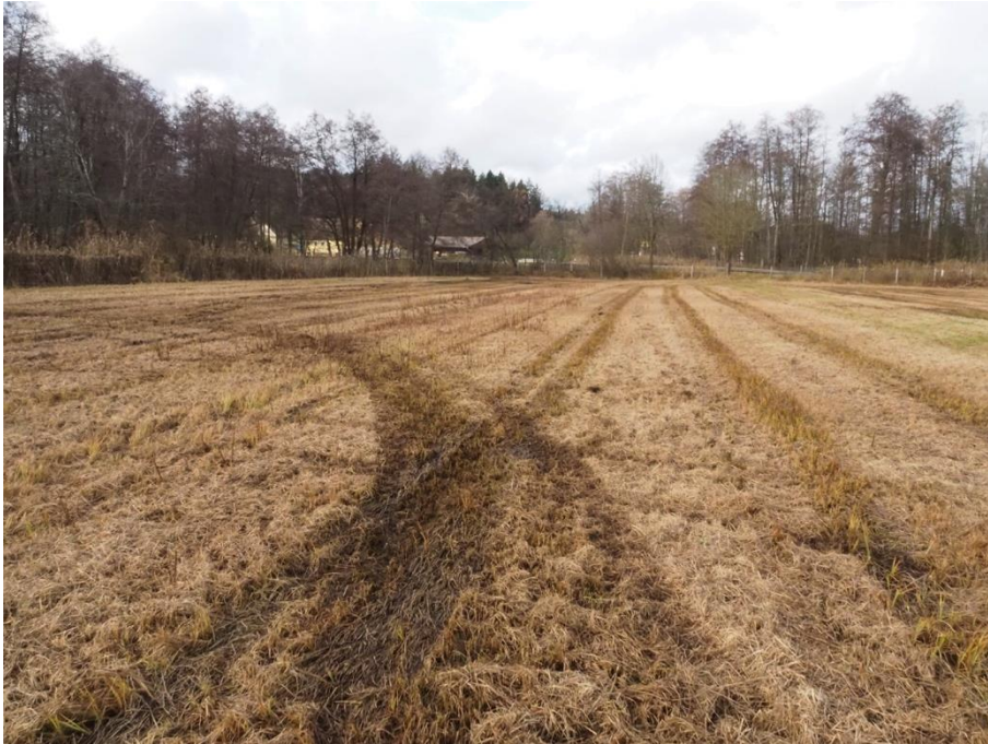
Abb. 4: Planungsgebiet mit Blick in das Labertal in Richtung Norden