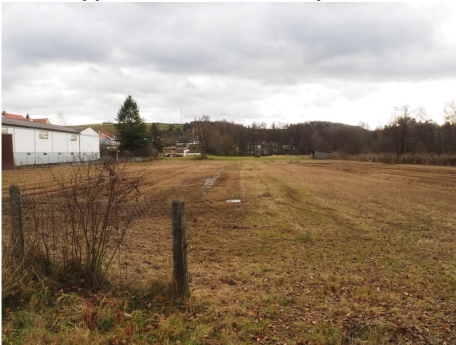
Abb. 5: Planungsgebiet mit Blick in das Labertal in Richtung Süden

Auswirkungen: Betriebsbedingt entstehen geringe Belastungen.