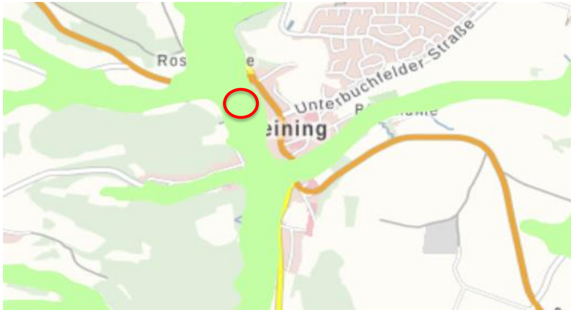
Abb. 3: Wassersensible Bereiche um Deining Ausschnitt aus Bayernatlas – Stand Nov. 2019 (roter Kreis = Planungsgebiet, grün = wassersensibler Bereich)